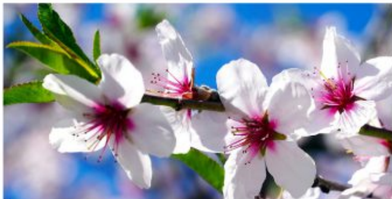
La floración propia de estas fechas.

"La vida sigue" , el mantra bienintencionado de los últimos meses. Y, si, el pasado va difuminándose inmisiblemente. Y aunque cada día sigue teniendo bastante con su propio afán, es inmeditable la desazón por un futuro distinto al soñado. Porque el curso de la vida, si indiferente, sigue.