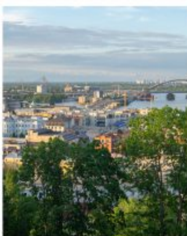
Kiev, capital de Ucrania, antes del inicio de la invasión rusa.

Aunque la subida de precios ayude a disminuir el peso real de la deuda, el resto de sus efectos son bastante negativos y sobre todo si las tasas alcanzan el nivel que se avizora, habrá dificultades para las familias que deben destinar más renta a la compra de bienes básicos, reducción del ahorro, alza en los costes de producción que pueden hacer perder capacidad competitiva a nuestras empresas, etcétera, etcétera. La situación actual va a afectar a la previsión de crecimiento económico que, sin