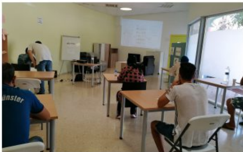
Acción formativa en el marco del Programa Incorpora de la Caixa.

forma de inserción social. Para ello, tiende puentes entre las empresas y cerca de 500 entidades sociales que desarrollan el programa y con las que Fundación "la Caixa" está renovando los acuerdos de colaboración por décimo sexto año consecutivo. En Almería, las entidades que desarrollan el programa son: Innova Almería, El Saliente, NOESSE y CEPAM. En 2021, estas entidades intensificarán su labor para dar respuesta a las nuevas necesidades surgidas a través de la red de técnicos del programa, que ofrece atención personalizada y seguimiento continuado a los participantes, antes, durante y después de su contratación.