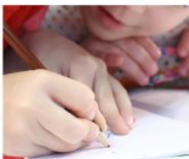
Este proyecto cubre necesidades socioeducativas.

Esta aportación corresponde a la convocatoria de Lucha contra la pobreza y la exclusión social, enmarcada en el Programa de Ayudas a Proyectos de Iniciativas Sociales que impulsa anualmente la Obra Social "la Caixa" y cuyo objetivo es ofrecer oportunidades a los colectivos en situación de vulnerabilidad social. El proyecto social Ludoteca Todos Juegan se lleva a cabo en el barrio de las Tejas de Albos, con el objetivo de cubrir las necesidades socioeducativas de menores en situación