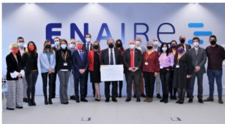
Acto institucional que ha congregado a todas las entidades receptoras de una ayuda de ENARE.

profesional para las personas con discapacidad. En total se benefició de esta acción formativa 10 personas con discapacidad en los sectores de limpieza y cocina. Consta de una fase inicial teórica para dotar a las personas participantes de conocimientos y posteriormente pasar a la fase de realización de las prácticas que mejoren su capacitación y así facilitar su inserción laboral.