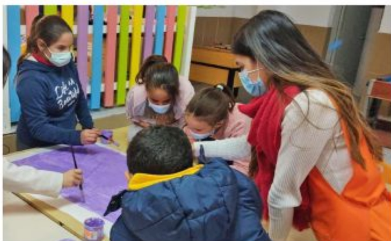
En la Ludoteca Todas Juegan se contribuye a la socialización y a la adquisición de valores.

educativo a 40 menores con dificultades en la promoción académica, sino que contribuye a su socialización y a la adquisición de valores, evitando que puedan caer en el desarraigo o la marginación social. Gracias a esta iniciativa se les proporciona los recursos materiales necesarios y se llevan a cabo talleres lúdicos orientados a la gestión de conflictos, la relación con iguales, superación, etc.