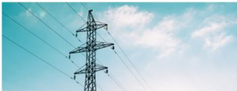
El precio de la electricidad está alcanzando máximos históricos.

■ Texto de Diego Rodríguez Rodríguez, Universidad Complutense de Madrid y Fedea.