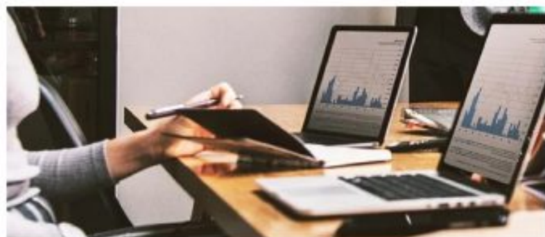
Entre otras cosas, el texto legislativo busca mejorar los sistemas públicos de protección social.

Se promueve la estabilidad en el empleo y se limita el uso abusivo, injustificado y desproporcionado de la contratación temporal