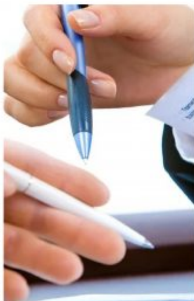
La nueva ley introduce cambios de calado.

Igualmente, se establece una modernización en la subcontratación de las actividades empresariales, estableciendo como novedad que, el convenio colectivo de aplicación para las empresas contratistas y subcontratistas será el del sector de la actividad desarrollada en la contrata o subcontrata, con independencia de su objeto social o forma jurídica, salvo que exista otro convenio sectorial aplicable (art. 42.6 ET). Cuando la empresa contratista o subcontratista