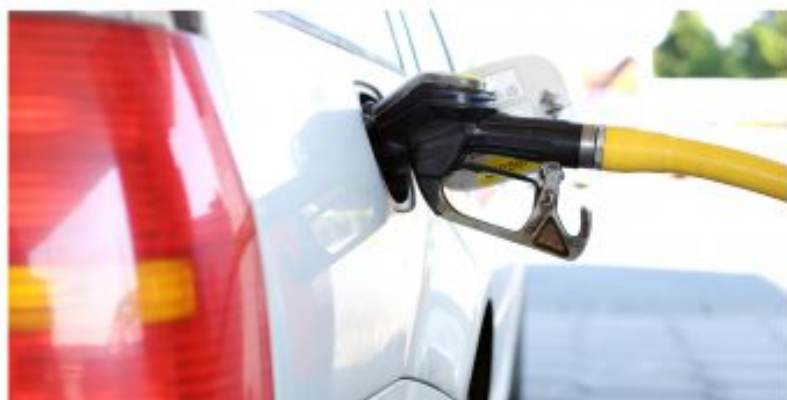
Los precios han subido a gran velocidad, incluidos los de los carburantes.

El horizonte parecía positivo en los primeros días de 2022 a poco que la estabilidad se ampliara a España y al mundo