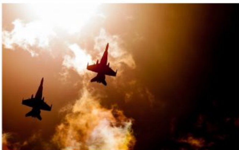
La guerra es fruto de la codicia y arrojó miles de víctimas inocentes.

La vida sigue, sí. Aunque un sátrapa paranoico, megalómano y sacrilego, ponga en riesgo universal su curso, empeñándose irresponsablemente en hacer real y explícita la imagen bíblica de los cuatro jinetes del Apocalipsis, haciendo ahora cabalgar, enloquecido y desbocado, el corcel rojo de la Guerra. Dos años lleva trotando, de color verde, canchaleando por los cinco continentes, el jinete de la Peste, ahora se alterna, sembrando la trágica cosecha del yóquey escarlata desatado por el déspota oriental, con el amarillo de la Muerte, quien, de no poner remedio al estrapicio del agresor infame, sería la única y última alternativa tras traer a concurso al rejoneador negro del Hambre.