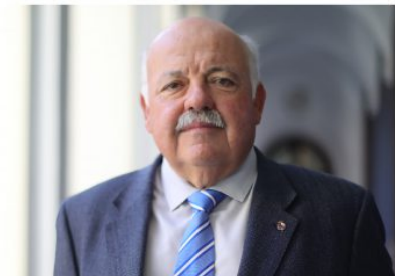
Jesús Aguirre, Consejero de Salud y Familias de la Junta de Andalucía

y servicios (auxiliares administrativos), lo que ha permitido mantener abiertos los 1.512 centros de Atención Primaria. Además, tras la finalización de los contratos eventuales por coyuntura Covid-19 en el pasado mes de septiembre de 2020, se renovó a todos los facultativos en esta situación, algo que volvemos a hacer ahora hasta finales del 2022 con un importante esfuerzo, porque vamos a destinar 347 millones de euros más de los previstos hasta abril. En total, en 2022 destinaremos 504,5 millones de euros para los refuerzos de Covid-19.