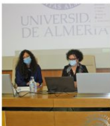
Un momento de la jornada celebrada en la UAL.