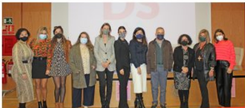
Foto de familia con las intervencientes y miembros de la Asociación El Silbante.

aportado su propio testimonio como una historia de lucha, superación y ejemplo de participación plena y la oportunidad gratificante de empoderamiento e inserción laboral que ha tenido.