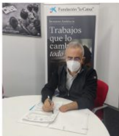
Firma de la renovación del convenio con Incorpora.

"Este año ha sido más significativo que nunca el refuerzo de nuestra línea de atención a la salud mental, impulsando oportunidades de empleo a personas con trastornos psicológicos y creando herramientas y recursos para los profesionales de la Red Incorpora con el objetivo de mejorar la atención y el acompañamiento a las personas que lo necesitan", afirma el presidente de la Fundación "la Caixa", Ildia Farié. Incorpora