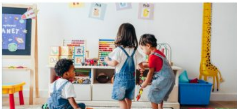
El juego forma parte del aprendizaje en la etapa infantil.

se modifica la Ley Orgánica 2/2006, de 3 de mayo, de Educación, la educación infantil se convierte en un periodo educativo con identidad propia, que tiene encomendado el desarrollo del ejercicio del derecho a la educación, en esta temprana edad comprendida entre el nacimiento de niñas y niños hasta el momento en que alcanzan los seis años.