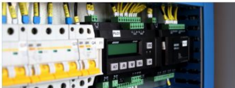
El cálculo de la factura se realiza mediante un proceso con muchas particularidades.

Como no la hay (las interconexiones son limitadas y se saturan), los precios divergen entre países porque no es posible llevar toda la electricidad desde el mercado con el precio más barato al mercado con el precio más caro. Por ejemplo, como entre España y Portugal hay mucha interconexión los dos países tienen los mismos precios en prácticamente la totalidad de las horas del año. En cambio, entre España y Francia solo coinciden estrictamente en, aproximadamente, el 40% de las horas del año.