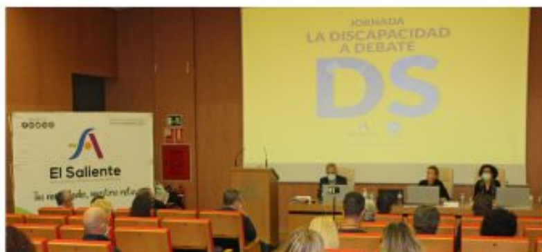
Acto inaugural de la Jornada "La Discapacidad a Debate".

de medidas puestas en marcha en el marco de este proyecto, entre las que se ha incluido la celebración de la Jornada "Mujer y Discapacidad".