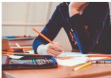
En los últimos años ha aumentado la violencia en las aulas.

Lo mismo ocurre con las personas, todos los individuos somos muy fuertes, pero a veces nos ocurren o nos suceden acontecimientos o hechos que nos van desgastando y nos van disminuyendo esas fuerzas, de manera que, en algún momento de la vida, si no disponemos del apoyo necesario podemos caer