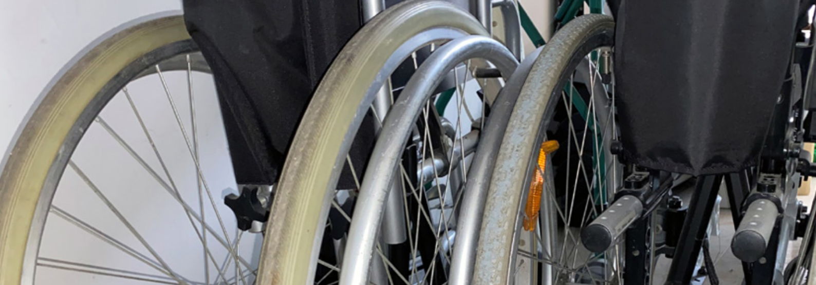
Sillas de ruedas del Banco de Préstamo de Ayudas Técnicas.