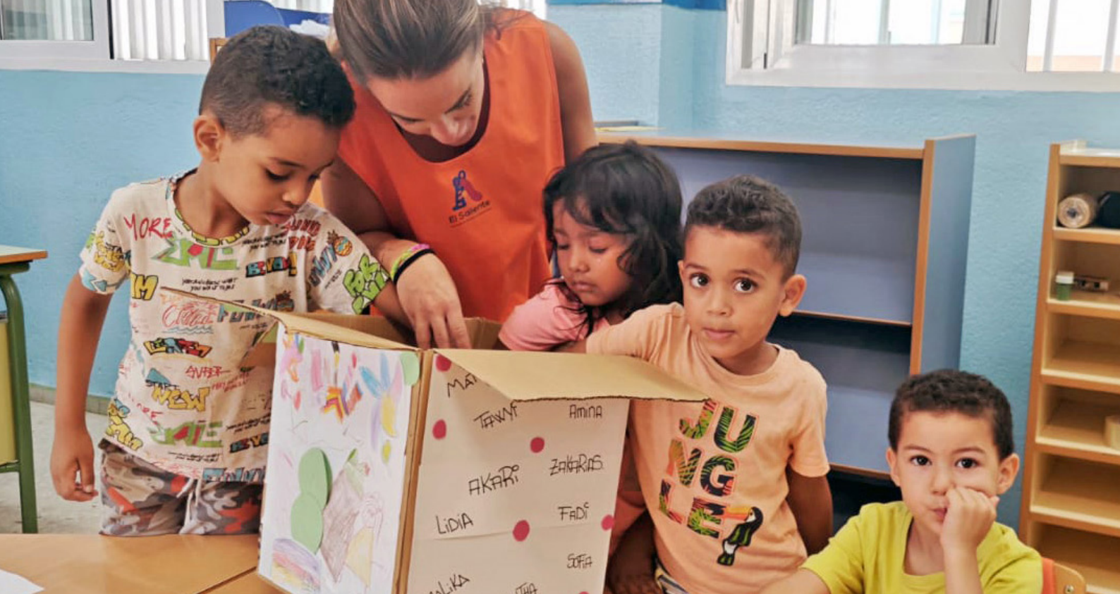
Escuela de Verano Todos Juegan.