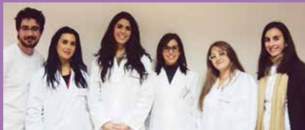
Equipo del CAI en Albox (arriba) y Almería (abajo).