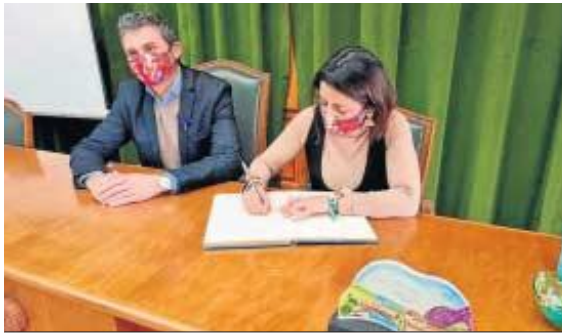
La presidenta del Parlamento participó en los actos del 8M en Los Gallardos.

● Durante su visita el Ayuntamiento de Los Gallardos, la presidenta del Parlamento mandó un mensaje de ánimo y apoyo a las mujeres