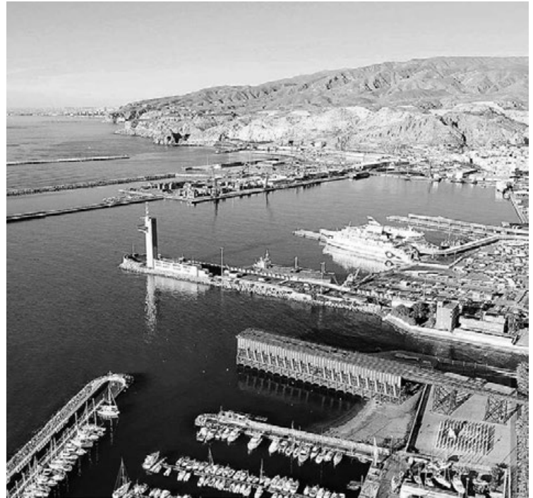
Vista aérea de parte de la zona que se cedería al Ayuntamiento. LA VOZ

Precisamente para esta zona la Autoridad Portuaria adjudicaba en diciembre la redacción del 'Proyecto de ampliación y adecuación del Muelle de Levante para Tráfico de Cruceros y Recuperación Ambiental del Frente Marítimo de la Zona de las Almadrabillas en el Puerto de Almería' a la Unión Temporal de Empresas (UTE) integrada por Estudio 7 Soluciones Integrales SL y Proes Consultores SA para lo que tiene siete meses de plazo.