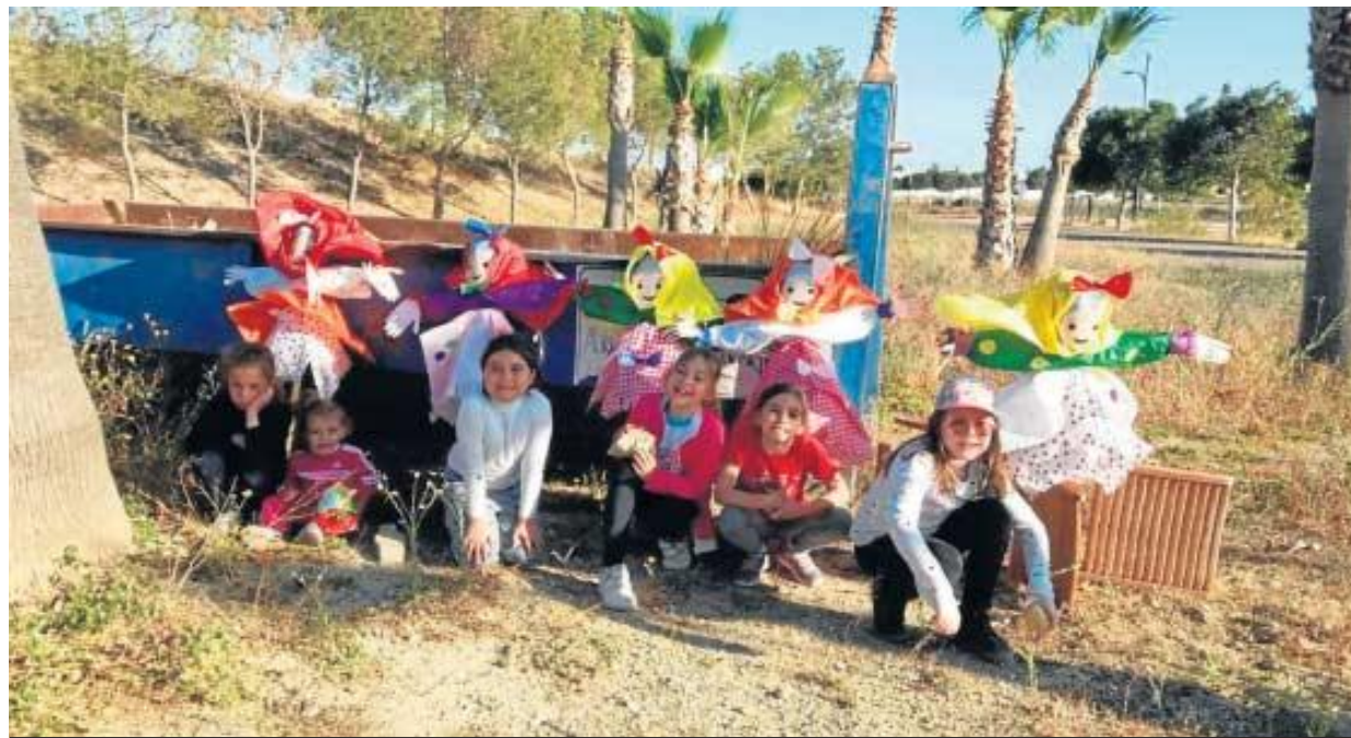
Un grupo de niños celebra el Día de la Vieja en Vera hace unos años.